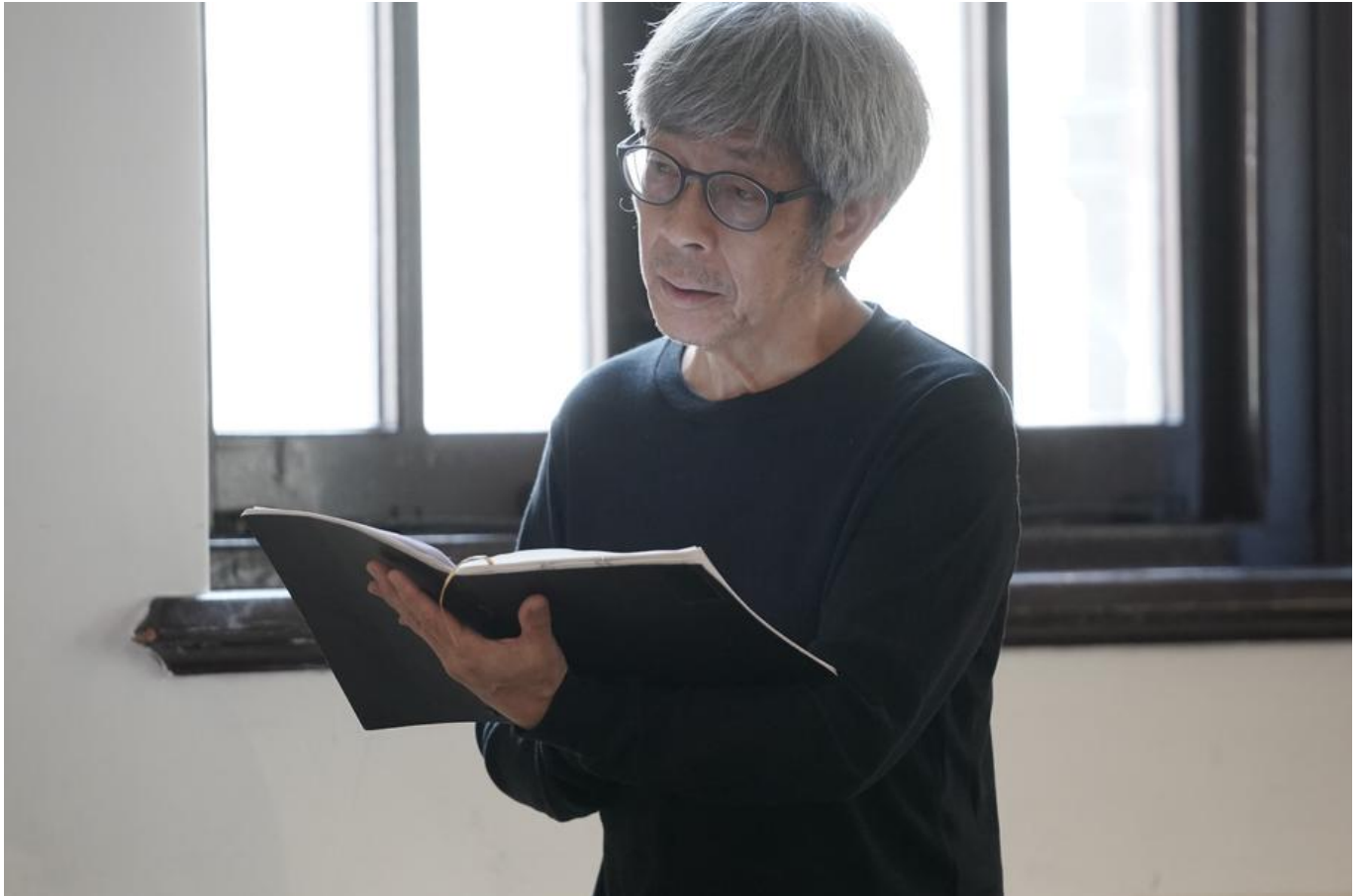
▲ 雄仔叔叔

《安魂曲》是誕生於大館的作品，作曲家鄺展維(Charles) 參與了大館當代美術館的駐場計劃，在大館渡過了不知幾多個晚上，夜闌人靜，在這個滿載生死的歷史的空間，想到以「儀式」作為創作起點。